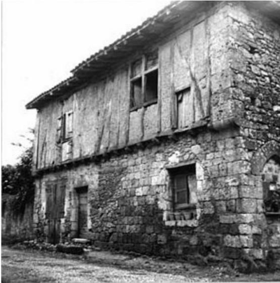
8, rue de l'école