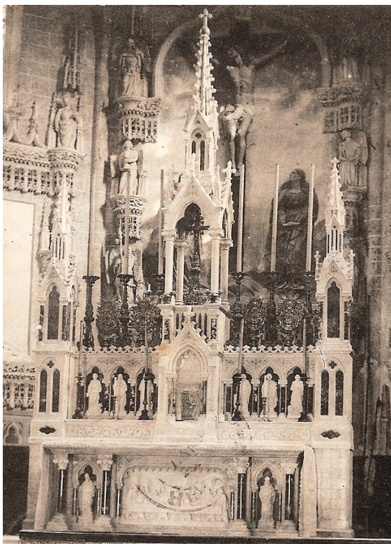
Le maître-autel vers 1950