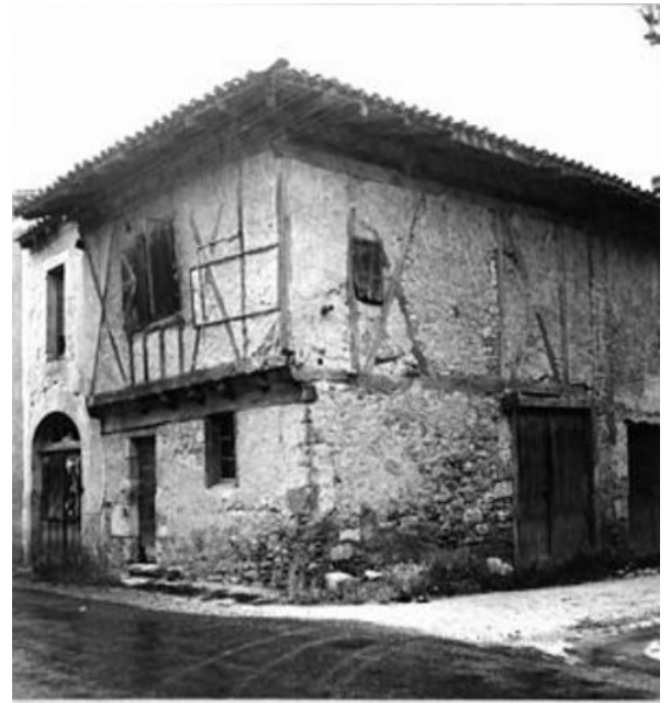
23, rue Saluste du Bartas