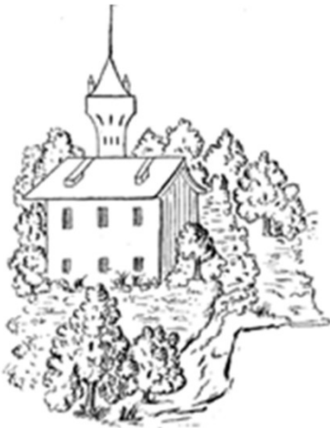
Croquis du château construit en 1568 par des maçons Monfortois

Son père ayant acheté une importante propriété au Bartas, à la mort de celui-ci le poète la transforma en château et devint ainsi le seigneur du Bartas ; il passera une grande partie de sa vie dans ce château situé entre Mauvezin et Cologne. (2)