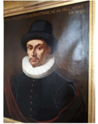
Portrait Saluste du Bartas salle des Illustres à Auch

« En venant peu à peu de Monfort approcher « Salluste me montra de loin un grand clocher « Qui semblait, orgueilleux, avec sa pointe aigüe « Voulant outre passer l'épaisseur de la nue « Voila le lieu, dit il, de ma nativité « Voila Monfort, qui m'a dans ses bras allaité ; « Monfort qui nous témoigne, avec sa petitesse, « Que c'était en son temps quelque grande forteresse. « Monfort qui, ferme assis sur le front d'un rocher « Qu'un grand camp n'oserait sans canon approcher